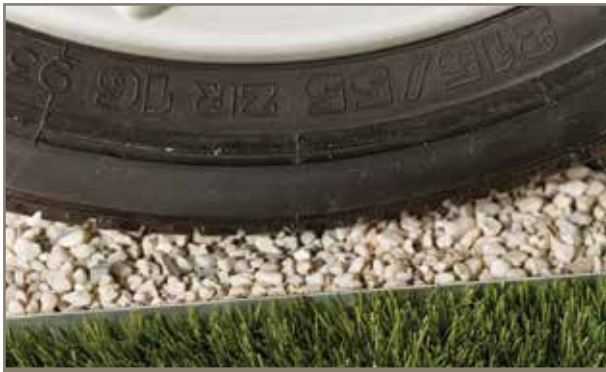
BERA® T-Edge Pro